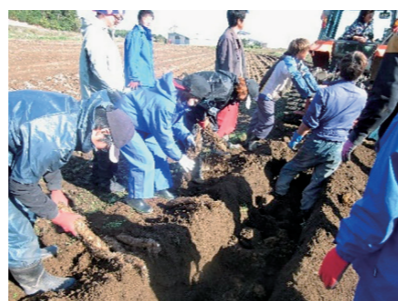
ながいもの収穫作業

なお、多くの会社では、副業・兼業を禁止していますので、就業規則の見直しが必要です。