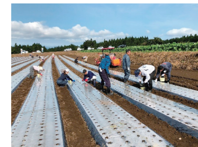
にんにくの植付け作業

在籍型出向は、労働者が出向元との労働契約関係を維持しつつ、出向先との間に労働契約を締結し、出向先において労務を提供する就業形態です。