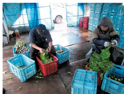
こかぶの洗浄作業

新型コロナウイルス感染症の影響を受けている期間の所得を確保するため、希望に応じて、短期アルバイト先のマッチングをします。